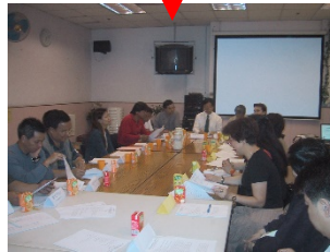
i) 策劃及統籌委員會