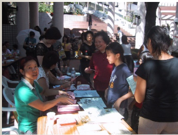
ii) 義工網絡 (社區服務/活動)