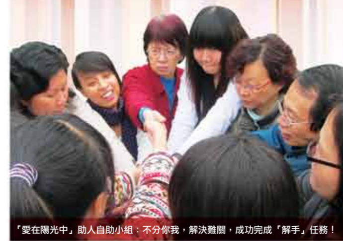
「愛在陽光中」助人自助小組：不分你我，解決難關，成功完成「解手」任務！