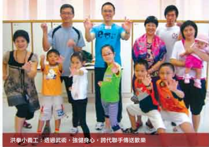
洪拳小義工：透過武術，強健身心，跨代聯手傳送歡樂