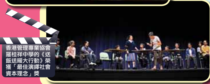
香港管理專業協會羅桂祥中學的《送飯送暖大行動》榮獲「最佳演繹社會資本理念」獎