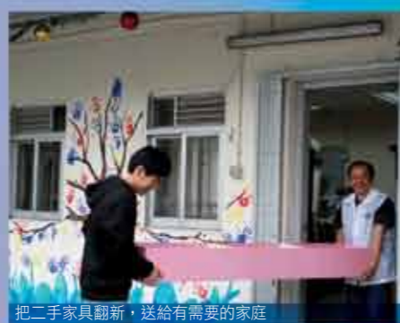
把二手家具翻新，送給有需要的家庭

明天，或是像雪地嚴寒，或遇著艱辛境況，或許波浪澎湃升降，愛心吹、愛意飛，傳遞社區正能量，因您用真愛將心熱燙！