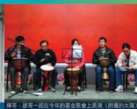
輝哥、雄哥一起在今年的基金聚會上表演〈朗邊的太陽〉