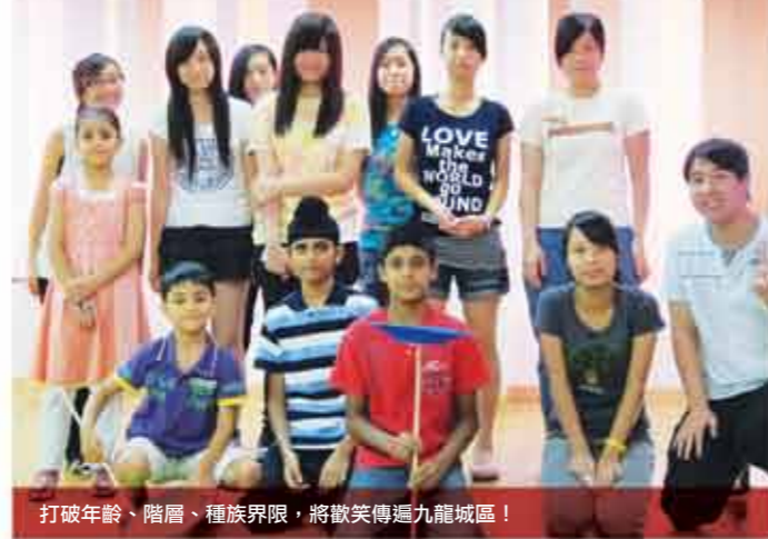
打破年齡、階層、種族界限，將歡笑傳遍九龍城區！