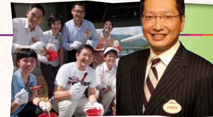
金民豪先生 香港迪士尼樂園度假區行政總裁

關懷社群，支持公益事務，一向是迪士尼的傳統；香港迪士尼樂園度假區秉承這個傳統，在公司內外，積極推動關懷文化。