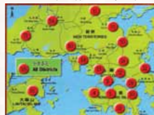
Distribution Map of Approved Projects (1-15 batch)

Note : 1. Withdrawn and lapsed projects are not involved 2. Projects may target at more than one district