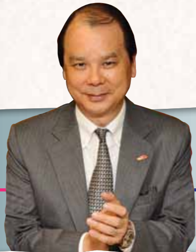
張建宗先生, GBS, JP 勞工及福利局局長

Mr. Cheung Kin-chung, GBS, JP Secretary for Labour and Welfare