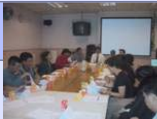
策劃及統籌委員會